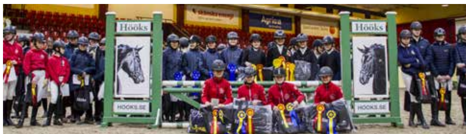
Ridskolecupen på Flyinge.

Under sommaren 2019 deltog ett stort antal ridlärare och ridskolepersonal vid en gratis inspirationsträff under Falsterbo Horse Show. Tränare och diplomerade ridlärare har under året erbjudits ett flertal fortbildningar. Utöver detta genomfördes ett Ridskolekonvent hösten 2019 med fokus på frågor och önskemål som inkommit via tidigare genomförd enkätundersökning.